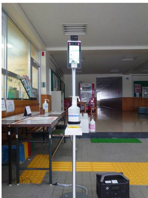
【山岡 B&G 海洋センター】 入り口に設置