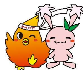
ハナッキー(♂) サリーナ(♀)