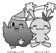
ハナッキー(♀) ナリーナ(♂)

※午後5時30分の時点で、気象警報又は熱中症特別警戒アラート等が発令中の場合は、教室を中止することがあります。中止決定は、恵那市体育連盟インスタグラムにて掲載いたします。 ※広報等掲載用に教室風景を撮影致しますので、ご承知おき下さい。